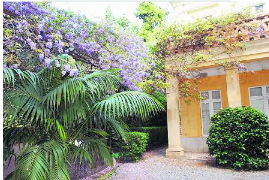
Im Botanischen Garten La Concepción in Málaga blühen derzeit die Glycinien. :: SUR

Nicht allen Großgrundbesitzern war es wichtig, dass ihr Land bewirtschaftet wurde oder gar aufgeforstet. Sie ließen es veröden und gaben es der Erosion preis. Sie hatten ja ausgesorgt. Ihnen fehlte es an nichts. Die Resignation der armen Bevölkerung, die hielt sich sehr lange. Bäume als Zierde, damit hatte keiner was im Sinn. Wer hat neue, unbekannte und exotische Pflanzen nach Málaga gebracht, nach La Concepción? Es war eine weltoffene Familie. Wer hat in Gerona Alleen und einen Park angepflanzt? Napoleon für seine Soldaten, damit die Schatten hatten. Wer hat in Blanes an der Costa Brava den ersten Botanischen Garten geschaffen? Ein Heidelberger Arzt. Jetzt wünsche ich mir nur, dass es mir gelingen möge, die Politiker von Torrox dafür zu sensibilisieren, Bäume zu mögen. Es wird noch dauern!