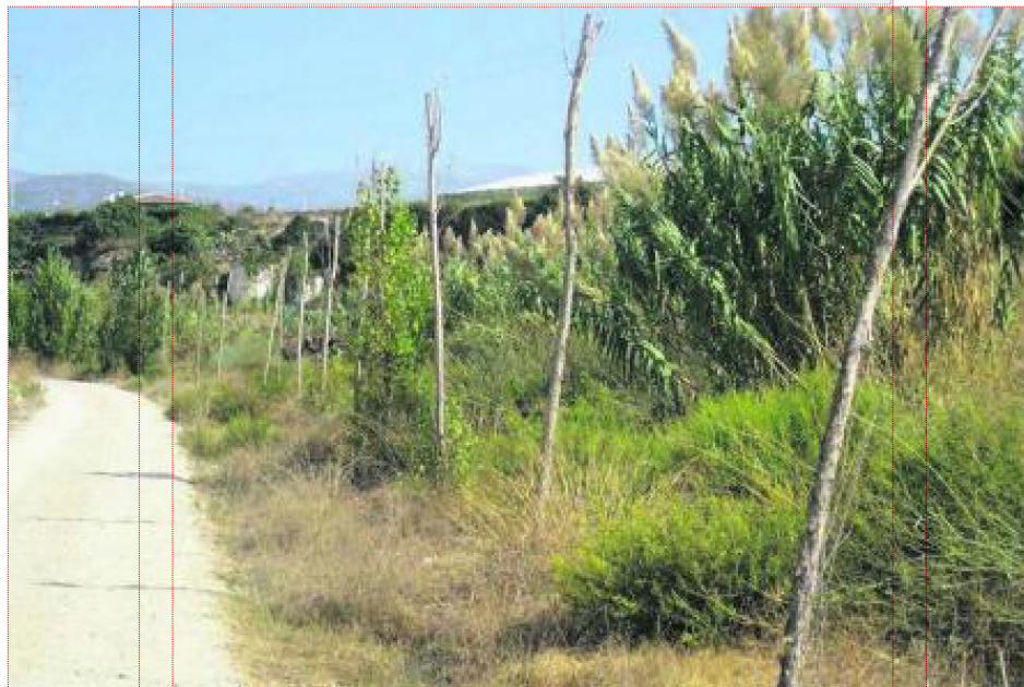
Fast 500 angepflanzte Bäume sind eingegangen.

Blumen, Pflanzen und besonders Bäume signalisieren ein Kulturbewusstsein. Hier leben Menschen, die wissen, wie wertvoll lebendiges Grün für die Bewohner ist, auch wenn in den